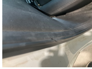
Kapı, sağ arka, Kapı fitili > Hasarlı