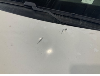
Motor kaputu, Motor kaputu > Hasarlı