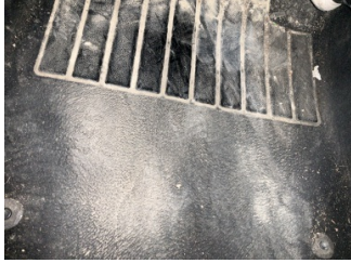
Taban, Paspaslar > Sökülmüş-Yok