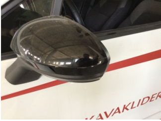
Dikiz aynası, sol, Dış dikiz aynası kapağı > Çizik