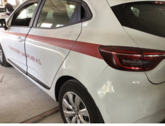
Kaporta, Kaporta > Etiket Yapıştırılmış