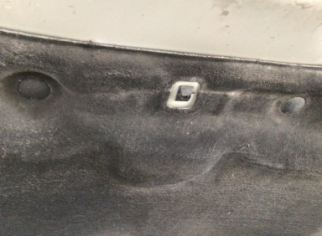
Motor kaputu, Dayama çubuğu/Amortisör > Kırılmış