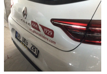
Kaporta, Kaporta > Etiket Yapıştırılmış