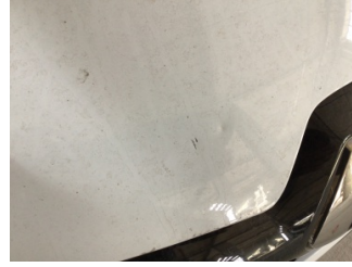
Motor kaputu, Motor kaputu > Taş Vuruğu