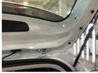
Döşemeler/Kapaklar, Pandizot > Hasarlı