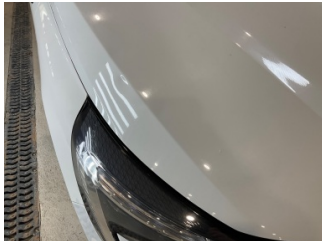
Motor kaputu, Motor kaputu > Ezik