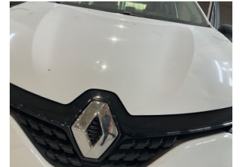
Motor kaputu, Motor kaputu > Ezik