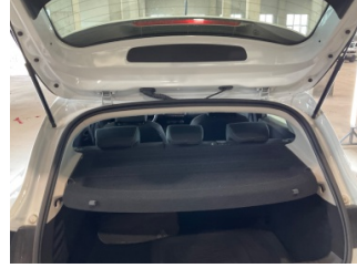
Döşemeler/Kapaklar, Pandizot > Hasarlı