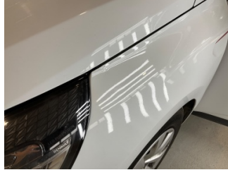
Çamurluk, sol, Çamurluk, sol > Standart Dışı Onarım