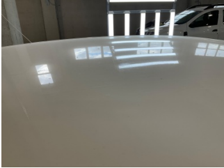
Tavan, Tavan > Deforme Olmuş