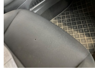
Koltuklar, ön, Koltuk döşemesi, sağ ön > Yakıcı Madde ile Zarar Görmüş