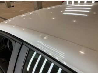
Kaporta, Sol Üst Frangart > Ezik