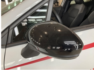
Dikiz aynası, sol, Dış dikiz aynası kapağı > Çizik