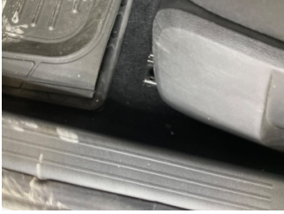
Taban, Taban halısı > Yakıcı Madde ile Zarar Görmüş