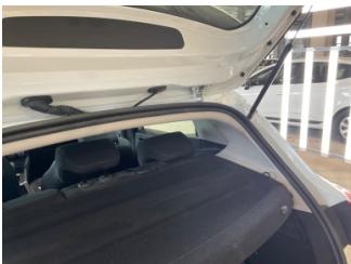
Döşemeler/Kapaklar, Pandizot > Hasarlı