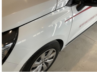
Çamurluk, sol, Çamurluk, sol > Ezik