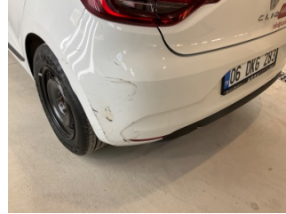
Tampon, arka, Arka tampon > Vuruk