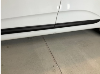
Marşbiyel, sol, Marşbiyel, sol > Ezik