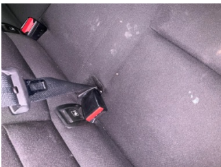
Koltuklar, arka, Arka koltuk döşemesi > Yakıcı Madde Ile Zarar Görmüş