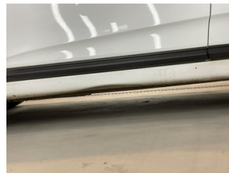
Marşbiyel, sol, Marşbiyel, sol > Hasarlı