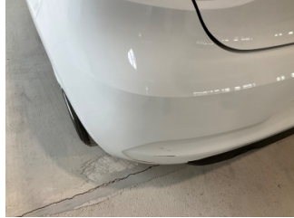
Tampon, arka, Arka tampon > Vuruk