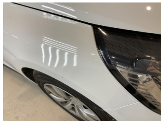
Çamurluk, sağ, Çamurluk, sağ > Standart Dışı Onarım