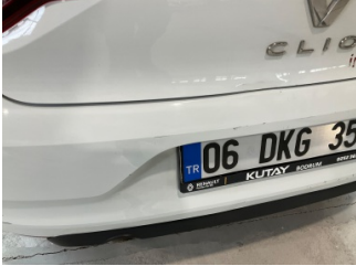
Tampon, arka, Arka tampon > Vuruk