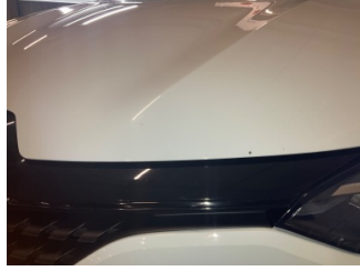
Motor kaputu, Motor kaputu > Taş lizi