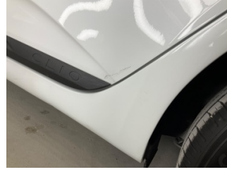
Kapı, sol arka, Kapı, sol arka > Rötüş