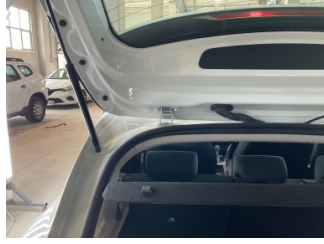
Döşemeler/Kapaklar, Pandizot > Hasarlı