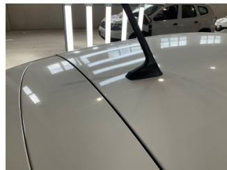
Tavan, Tavan > Ezik