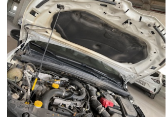
Motor kaputu, Dayama çubuğu/Amortisör > Hasarlı