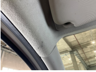
Döşemeler/Kapaklar, Tavan döşemesi > Yakıcı Madde ile Zarar Görmüş