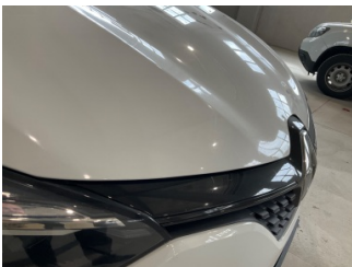
Motor kaputu, Motor kaputu > Ezik