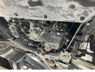
Motor, Alt muhafaza > Sökülmüş-Yok