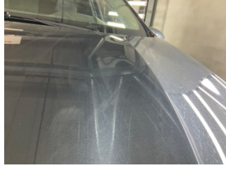
Motor kaputu, Motor kaputu > Noktasal Ezik