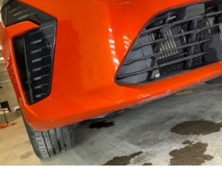
Tampon, ön, Ön tampon > Küçük Çizik