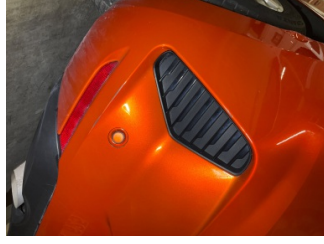
Tampon, arka, Arka tampon > Küçük Çizik