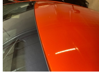
Tavan, Tavan > Taş Izi