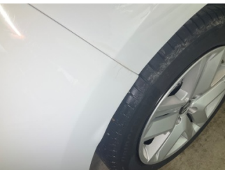
Tampon, arka, Arka tampon > Boyası Atmış