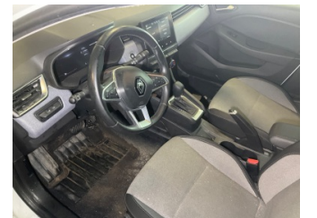
Taban, Paspaslar > Sökülmüş-Yok