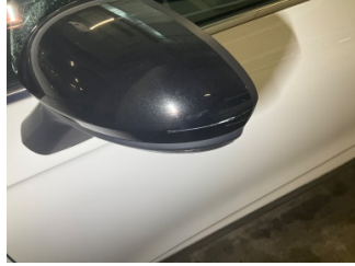
Dikiz aynası, sol, Dış dikiz aynası kapağı > Çizik