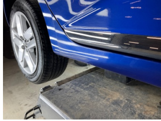
Marşbiyel, sağ, Marşbiyel, sağ > Çizik