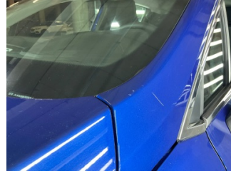
Tavan, Ön cam direği, sol > Çizik