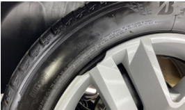
Jant kapağı, sol arka > Kırılmış