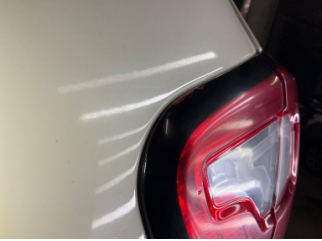
Arka lambalar, Arka lamba camı, sağ > Çatlak