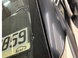
Camlar, Ön cam > Hasarlı