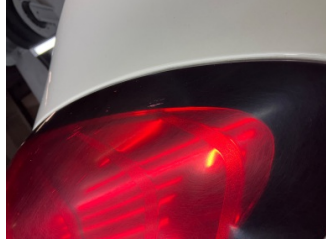
Arka lambalar, Arka lamba camı, sağ > Çatlak