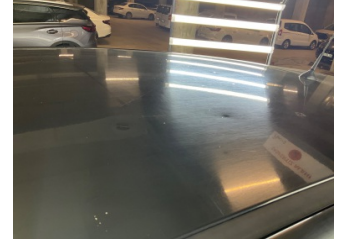
Tavan, Tavan > Dolu Hasarı