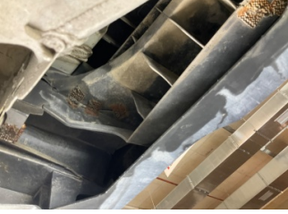
Tampon, arka, Bağlantı ayağı > Hasarlı