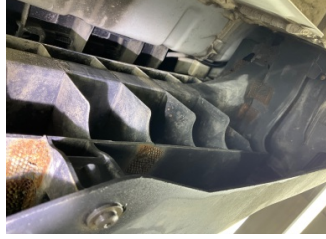
Tampon, arka, Bağlantı ayağı > Hasarlı