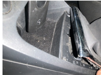
Şanzıman, Vites körüğü > Sabitlemesi Hatalı