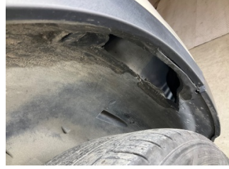
Çamurluk, sağ, Davlumbaz > Hasarlı