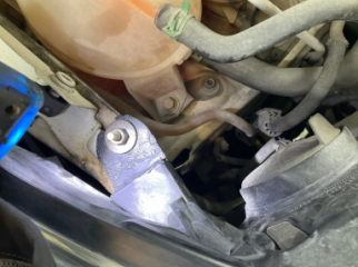
Farlar, Far bağlantı ayağı, sağ > Standart Dışı Onarım