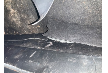
Döşemeler/Kapaklar, Bagaj bölümü döşemesi > Onaysız