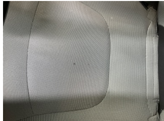
Döşemeler/Kapaklar, Döşemeler/Kapaklar > Yakıcı Madde ile Zarar Görmüş