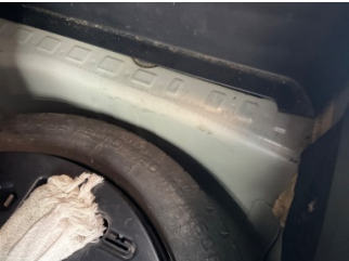
Arka bölüm, Bagaj havuzu > Boyası Atmış