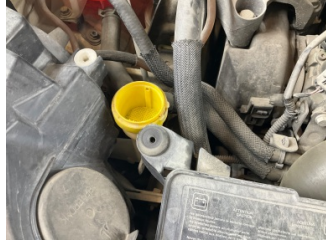
Cam yıkama/silme sistemi, Cam suyu bidonu kapağı > Sökülmüş-Yok