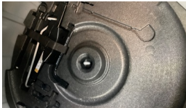
Stepne > Sökülmüş-Yok