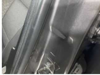
Kaporta, B-direk, sol > Çizik