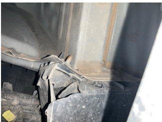
Arka bölüm, Arka sac/panel > Ezik