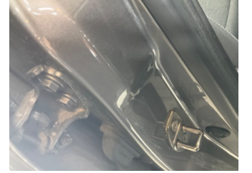
Kaporta, B-direk, sağ > Çizik