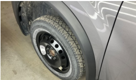
Lastik, sol ön > Hasarlı