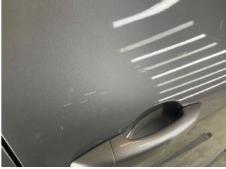
Kapı, sağ ön, Kapı, sağ > Çizik