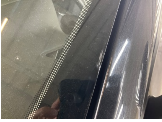
Camlar, Ön cam > Deforme Olmuş