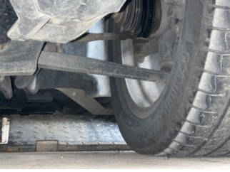
Ön aks, Aks mili, sol > Yağ Kaçağı