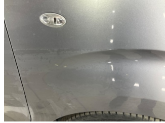
Kaporta, Kaporta > Boyası Atmış