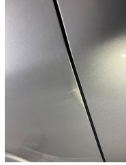
Kapı, sol arka, Kapı, sol arka > Rötüş