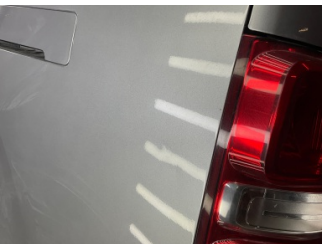
Çamurluk, sol arka, Çamurluk, sol arka > Vuruk