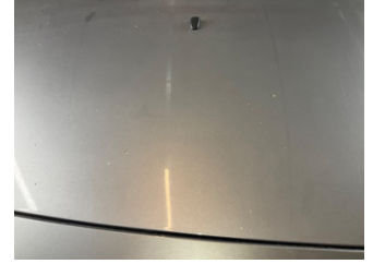
Kaporta, Kaporta > Boyası Atmış