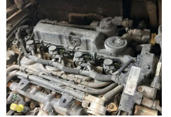
Motor, Motor üst kapağı, plastik > Sökülmüş-Yok