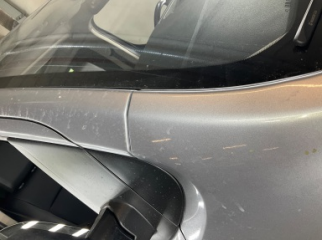
Kaporta, Kaporta > Boyası Atmış