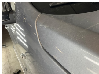
Çamurluk, sağ, Çamurluk, sağ > Vuruk