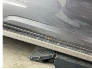
Marşbiyel, sağ, Marşbiyel, sağ > Boyası Atmış