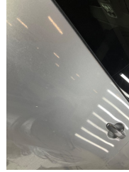
Kaporta, Kaporta > Boyası Atmış