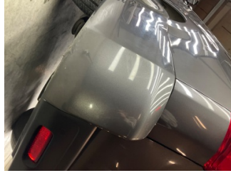
Tampon, arka, Arka tampon > Küçük Çizik