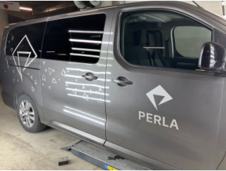
Kaporta, Kaporta > Etiket Yapıştırılmış