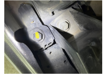
Farlar, Far bağlantı ayağı, sağ > Hasarlı