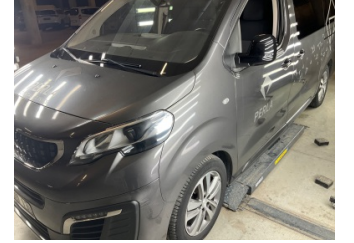
Kaporta, Kaporta > Etiket Yapıştırılmış