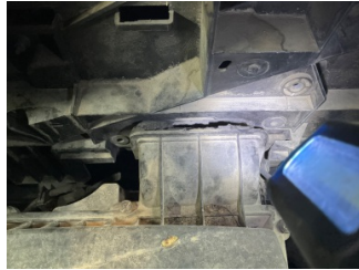
Motor, Hava filtresi kabı > Sabitlemesi Hatalı