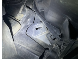
Farlar, Far bağlantı ayağı, sol > Hasarlı