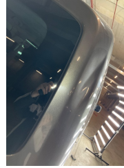
Bagaj kapağı/kapısı, Bagaj kapısı > Hasarlı