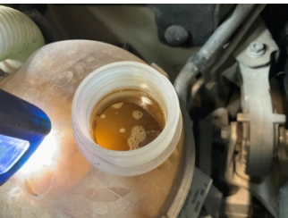
Motorsoğutması, Soğutma sıvısı > Kirlenmiş