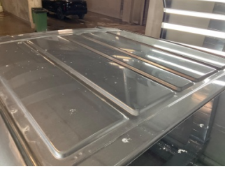
Tavan, Tavan > Yakıcı Madde İle Zarar Görmüş