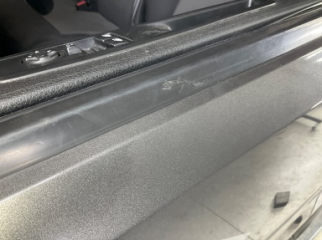
Kapı, sol ön, Cam sıyrıcı fitili, dış > Çizik