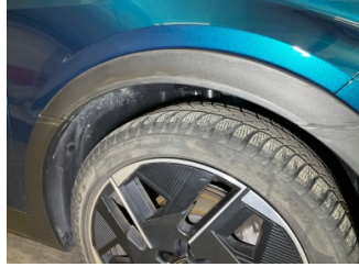
Çamurluk, sağ, Nikelaj, ızgara > Çizik