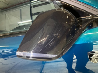
Dikiz aynası, sağ, Dış dikiz aynası kapağı > Çizik