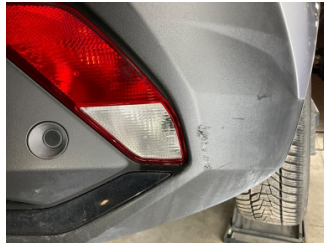
Tampon, arka, Arka tampon > Küçük Çizik