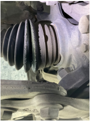
Ön aks, Aks mili, sol > Yağ Kaçağı