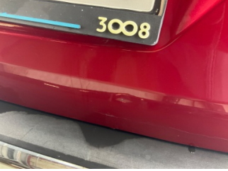
Bagaj kapağı/kapısı, Bagaj kapısı > Çizik