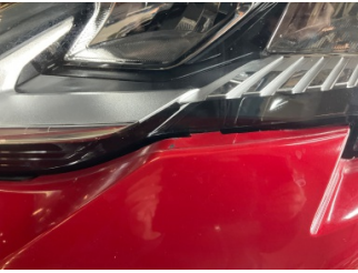
Tampon, ön, Ön tampon > Sabitlemesi Hatalı