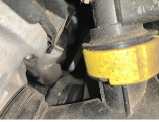
Motor, Motor > Yağ Kaçağı