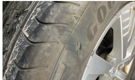
Lastik, sağ arka > Deforme Olmuş