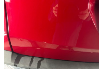
Bagaj kapağı/kapısı, Bagaj kapısı > Çizik