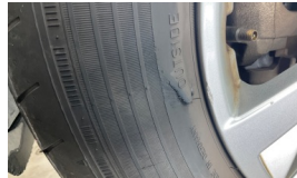
Lastik, sol ön > Hasarlı