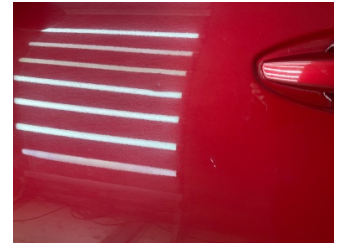
Kapı, sol ön, Kapı, sol > Noktasal Ezik