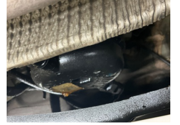
Motor, Motor/Yakıt sistemi > Sızdırıyor