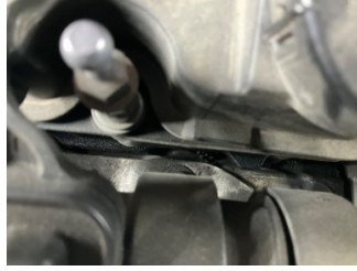
Motor, Motor > Yağ Kaçağı