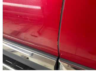
Kapı, sol ön, Kapı, sol > Çizik