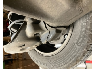
Kaporta, Muhafaza, arka > Hasarlı