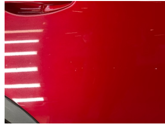
Kapı, sağ arka, Kapı, sağ arka > Taş izi