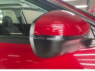
Dikiz aynası, sağ, Dış dikiz aynası kapağı > Çizik

Sayfa: 10/12 Araç Çıkış Tarihi: 14.05.2026 15:25