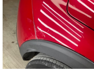
Çamurluk, sağ arka, Çamurluk, sağ arka > Standart Dışı Onarım