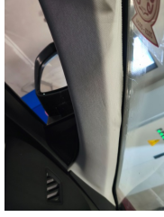
Döşemeler/Kapaklar, Döşemeler/Kapaklar > Sabitlemesi Hatalı