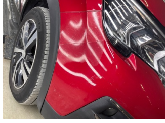
Tampon, ön, Ön tampon > Boyası Atmış