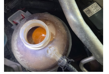
Motorsoğutması, Soğutma sıvısı > Kirlenmiş