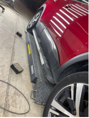
Marşbiyel, sağ, Marşbiyel plastığı, sağ > Hasarlı