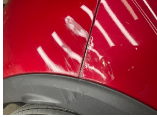
Çamurluk, sağ arka, Çamurluk, sağ arka > Hasarlı