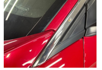
Çamurluk, sol, Nikelaj, ızgara > Noktasal Ezik