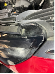
Farlar, Far camı, sol > Çatlak