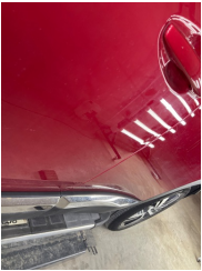
Kapı, sol ön, Kapı, sol ön > Vuruk