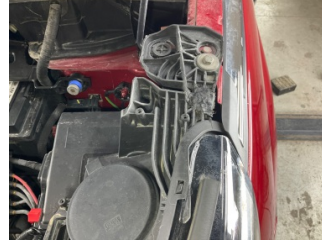
Farlar, Far bağlantı ayağı, sol > Standart Dışı Onarım