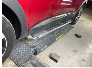
Marşbiyel, sol, Marşbiyel plastığı, sol > Hasarlı