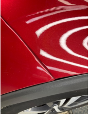
Tampon, ön, Ön tampon > Boyası Atmış

Sayfa: 11/12 Araç Çıkış Tarihi: 01.06.2026 10:37