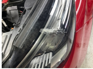
Farlar, Far camı, sol > Çatlak