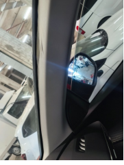
Döşemeler/Kapaklar, Döşemeler/Kapaklar > Sabitlemesi Hatalı