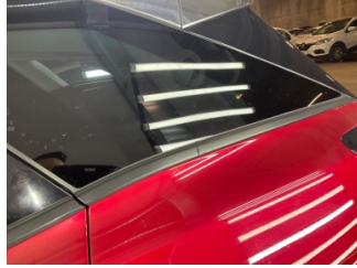
Camlar, Arka cam fitili > Çizik