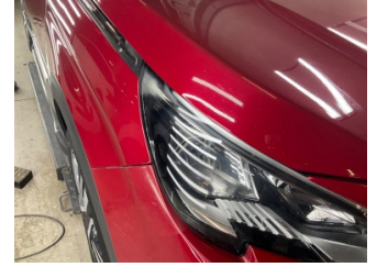
Farlar, Far camı, sağ > Deforme Olmuş