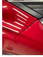
Kapı, sol ön, Kapı, sol ön > Rötüş