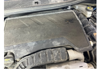
Motor, Motor üst kapağı, plastik > Deforme Olmuş