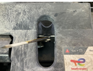
Motor, Yağ seviyesi > Eksik