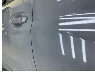
Kapı, sol arka, Kapı, sol arka > Noktasal Ezik