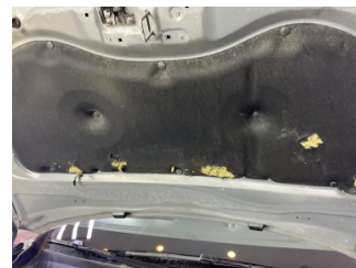
Motor kaputu, İzolasyon döşemesi > Hasarlı