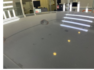
Tavan, Tavan > Yakıcı Madde ile Zarar Görmüş