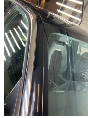
Kaporta, Kaporta > Taş İzi