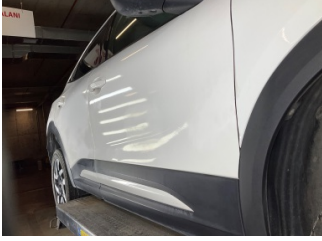
Kaporta, Kaporta > Renk Farkı