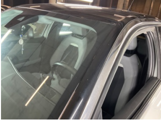
Kaporta, Kaporta > Taş İzi