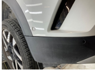
Tampon, ön, Spoiler > Sabitlemesi Hatalı