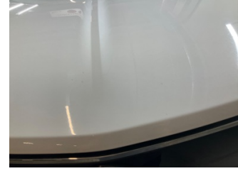
Kaporta, Kaporta > Taş İzi