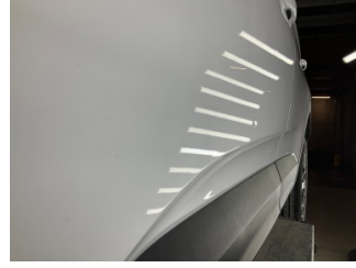
Kapı, sol ön, Kapı, sol ön > Noktasal Ezik