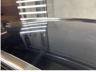
Tavan, Tavan > Yakıcı Madde İle Zarar Görmüş