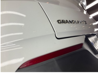
Tampon, arka, Arka tampon > Rötüş