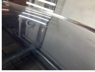
Tavan, Tavan > Rötüş