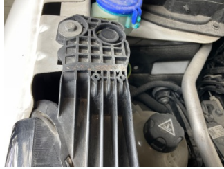
Farlar, Far bağlantı ayağı, sağ > Standart Dışı Onarım