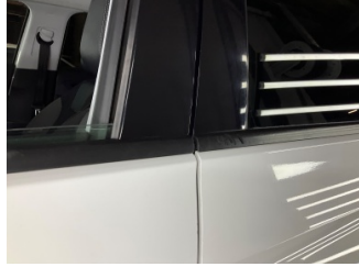
Camlar, Kapı camı fitili, sol arka > Çizik