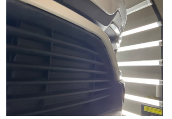
Tampon, ön, Ön tampon ızgarası > Sabitlemesi Hatalı