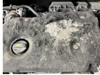
Motor, Motor üst kapağı, plastik > Deforme Olmuş