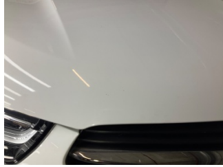
Motor kaputu, Motor kaputu > Taş İzi