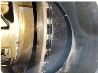
Motor, Triger kayışı > Çatlak