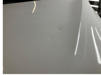
Motor kaputu, Motor kaputu > Vuruk