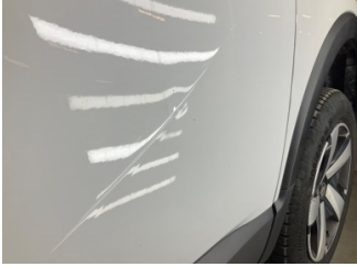
Kapı, sağ ön, Kapı, sağ ön > Vuruk