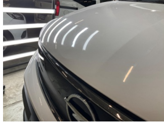
Motor kaputu, Motor kaputu > Vuruk