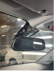
Döşemeler/Kapaklar, Döşemeler/Kapaklar > Eksik