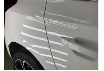
Kapı, sağ arka, Kapı, sağ arka > Küçük Çizik