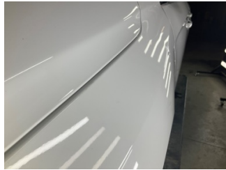
Çamurluk, sol, Çamurluk, sol > Vuruk