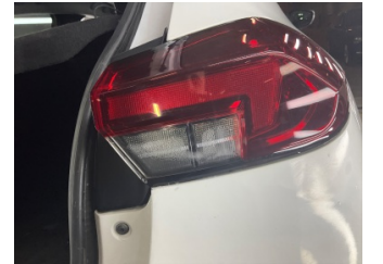
Arka lambalar, Arka lamba camı, sağ > Islak-Nemli