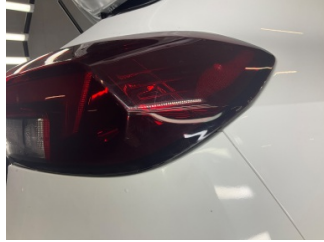
Arka lambalar, Arka lambalar, sağ > Sabitlemesi Hatalı