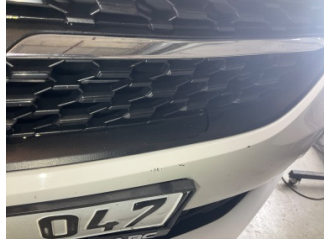
İlave parçalar, ön, Ön panjur > Hasarlı