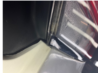
Arka lambalar, Arka lamba camı, sağ > Çatlak