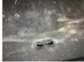
Döşemeler/Kapaklar, Bagaj kapağı, iç döşemesi > Onaysız