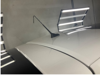
Komünikasyon/Navigasyon/Eğlence sistemleri, Anten > Hasarlı