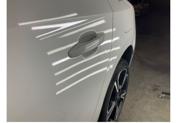
Kapı, sol arka, Kapı, sol arka > Noktasal Ezik