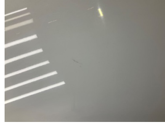
Kapı, sağ arka, Kapı, sağ arka > Küçük Çizik