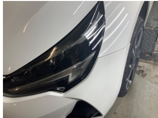
Tampon, ön, Ön tampon > Sabitlemesi Hatalı