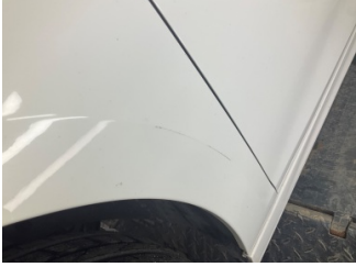
Çamurluk, sol, Çamurluk, sol > Küçük Çizik