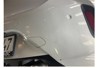
Tampon, arka, Arka tampon > Boyası Atmış