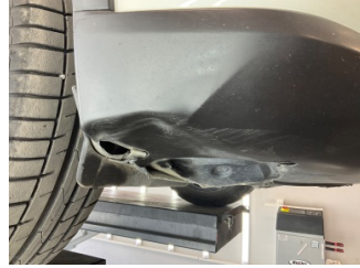
Tampon, ön, Spoiler > Hasarlı