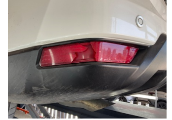
Tampon, arka, Reflektör, sol > Hasarlı