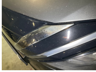
İlave parçalar, ön, Ön panjur > Deforme Olmuş