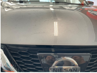
Motor kaputu, Motor kaputu > Çizik