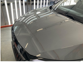
Motor kaputu, Motor kaputu > Deforme Olmuş