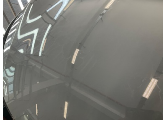
Motor kaputu, Motor kaputu > Deforme Olmuş