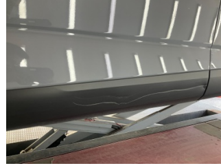
Kapı, sol ön, Kapı bandı > Hasarlı