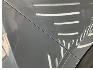
Çamurluk, sağ arka, Çamurluk, sağ arka > Rötüş