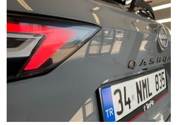
Bagaj kapağı/kapısı, Bagaj kapısı > Deforme Olmuş