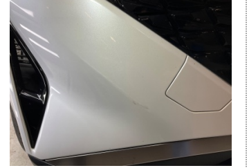
Tampon, ön, Ön tampon > Küçük Çizik