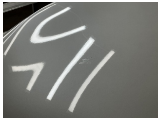
Motor kaputu, Motor kaputu > Yakıcı Madde Ile Zarar Görmüş