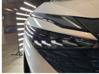
Farlar, Far camı, sağ > Taş Izi