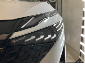
Farlar, Far camı, sol > Taş Izi