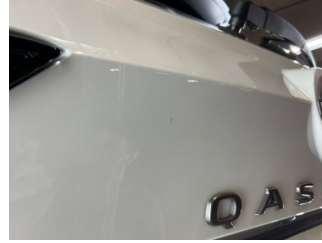
Bagaj kapağı/kapısı, Bagaj kapısı > Küçük Çizik