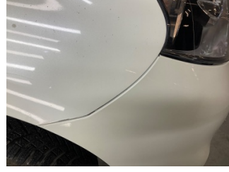
Tampon, ön, Ön tampon > Sabitlemesi Hatalı