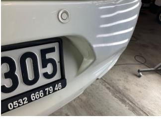
Tampon, arka, Arka tampon > Çatlak

Sayfa: 10/11 Araç Çıkış Tarihi: 11.06.2026 12:01