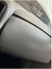
Pano/Göstergeler, Torpido gözü kapağı > Hasarlı