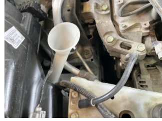
Cam yıkama/silme sistemi, Cam suyu bidonu kapağı > Sökülmüş-Yok