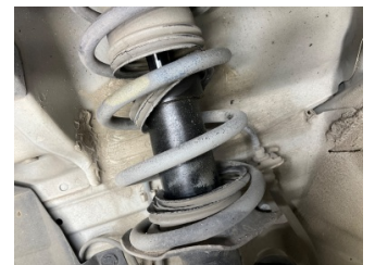
Ön aks, Amortisör, ön > Yağ Kaçağı