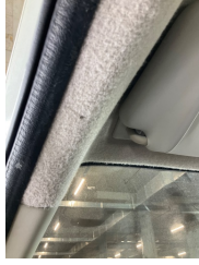
Döşemeler/Kapaklar, Döşemeler/Kapaklar > Yakıcı Madde Ile Zarar Görmüş