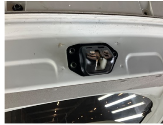
Bagaj kapağı/kapısı, Bagaj kapısı > Vuruk