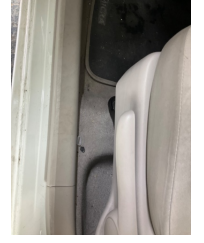
Döşemeler/Kapaklar, Döşemeler/Kapaklar > Yakıcı Madde Ile Zarar Görmüş