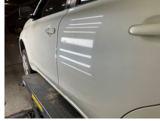
Kapı, sol arka, Kapı, sol arka > Vuruk