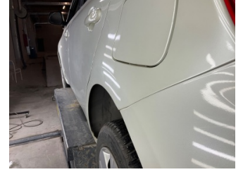
Çamurluk, sol arka, Çamurluk, sol arka > Vuruk