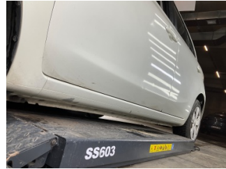
Marşbiyel, sol, Marşbiyel, sol > Boyası Atmış