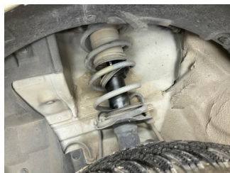
Ön aks, Amortisör körüğü, sol > Hasarlı