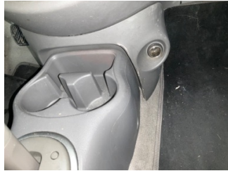
Pano/Göstergeler, Pano, orta > Hasarlı