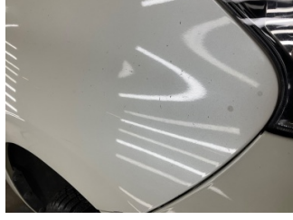
Çamurluk, sağ, Çamurluk, sağ > Boyası Atmış