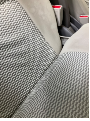
Döşemeler/Kapaklar, Döşemeler/Kapaklar > Yakıcı Madde Ile Zarar Görmüş