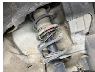
Ön aks, Amortisör körüğü, sol > Hasarlı