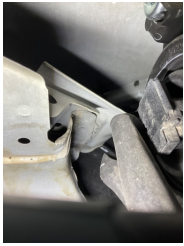
Kaporta, Sol Kılıç Sacı > Ezik