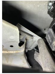
Çamurluk, sol, Bağlantı ayağı > Ezik