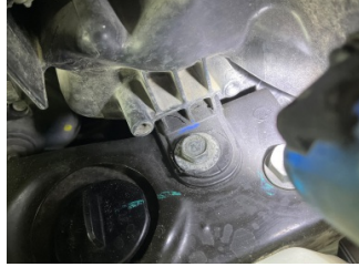
Farlar, Far bağlantı ayağı, sağ > Kırılmış