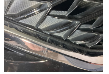
İlave parçalar, ön, Ön panjur > Kırılmış