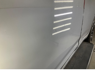
Kapı, sağ ön, Kapı, sağ ön > Taş izi