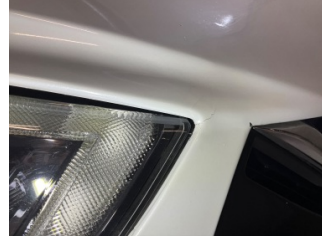
Tampon, ön, Ön tampon > Kırılmış