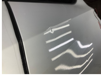
Kapı, sağ arka, Kapı, sağ arka > Küçük Vuruk