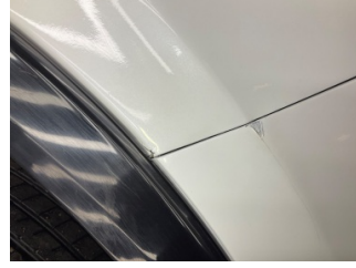
Çamurluk, sağ, Çamurluk, sağ > Boyası Atmış