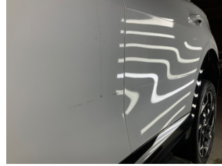
Kapı, sol arka, Kapı, sol arka > Yüzeysel Çizik