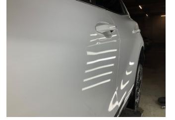
Kapı, sol ön, Kapı, sol ön > Küçük Vuruk