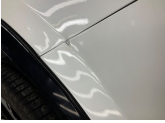
Tampon, ön, Ön tampon > Boyası Atmış