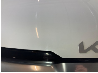
Motor kaputu, Motor kaputu > Taş İzi