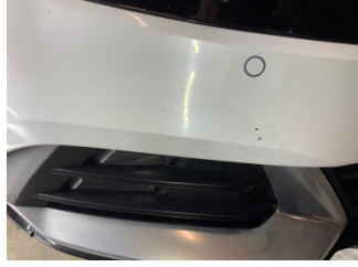
Tampon, ön, Ön tampon > Boyası Atmış