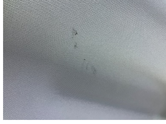
Döşemeler/Kapaklar, Tavan döşemesi > Yakıcı Madde ile Zarar Görmüş