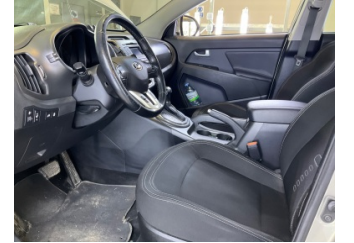
Döşemeler/Kapaklar, Döşemeler/Kapaklar > Deforme Olmuş