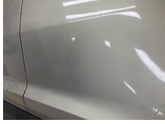
Kapı, sol arka, Kapı, sol arka > Ezik