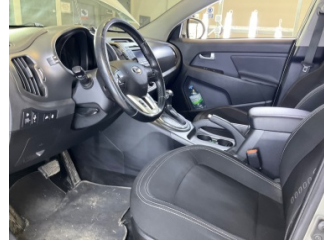
Döşemeler/Kapaklar, Döşemeler/Kapaklar > Çizik