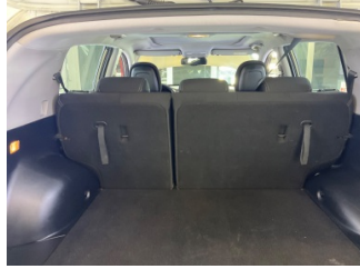
Döşemeler/Kapaklar, Pandizot > Sökülmüş-Yok