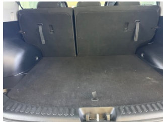
Döşemeler/Kapaklar, Döşemeler/Kapaklar > Deforme Olmuş