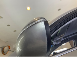
Dikiz aynası, sol, Dış dikiz aynası kapağı > Çizik