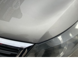
Motor kaputu, Motor kaputu > Çizik

Sayfa: 8/12 Araç Çıkış Tarihi: 31.03.2026 11:47