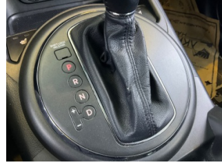
Şanzıman, Vites körüğü > Deforme Olmuş