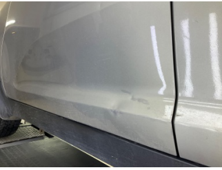
Kapı, sol ön, Kapı, sol ön > Hasarlı