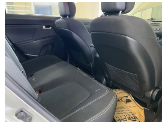
Döşemeler/Kapaklar, Döşemeler/Kapaklar > Deforme Olmuş