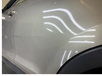
Kapı, sol arka, Kapı, sol arka > Çizik