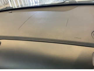
Pano/Göstergeler, Pano, orta > Hasarlı