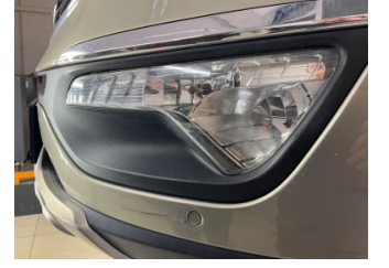
Sis lambaları, Sis farı camı, sol > Çizik