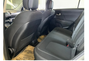
Döşemeler/Kapaklar, Döşemeler/Kapaklar > Çizik