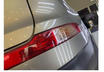
Tampon, arka, Reflektör, sağ > Çizik