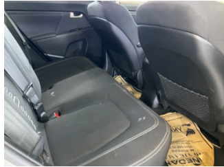
Döşemeler/Kapaklar, Döşemeler/Kapaklar > Çizik