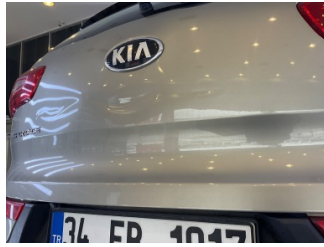
Bagaj kapağı/kapısı, Bagaj kapısı > Hasarlı