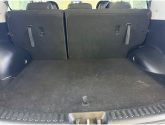
Döşemeler/Kapaklar, Döşemeler/Kapaklar > Çizik