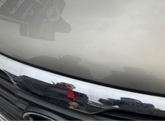
Motor kaputu, Motor kaputu > Ezik