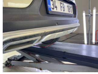
Tampon, arka, Spoiler > Çizik