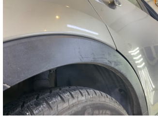
Çamurluk, sağ arka, Nikelaj > Çizik