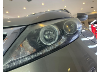
Farlar, Far camı, sol > Deforme Olmuş