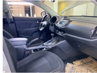
Döşemeler/Kapaklar, Döşemeler/Kapaklar > Çizik