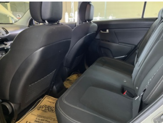
Döşemeler/Kapaklar, Döşemeler/Kapaklar > Deforme Olmuş