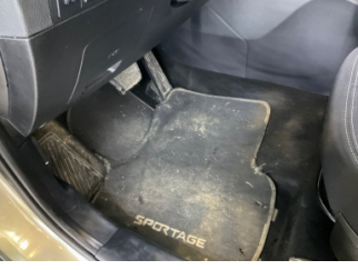
Taban, Paspaslar > Hasarlı

Sayfa: 10/12 Araç Çıkış Tarihi: 31.03.2026 11:47