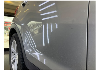
Kapı, sağ arka, Kapı, sağ arka > Hasarlı