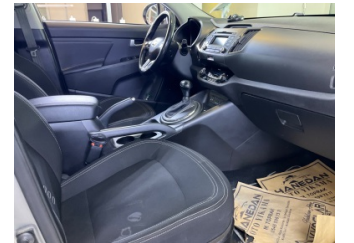
Döşemeler/Kapaklar, Döşemeler/Kapaklar > Deforme Olmuş