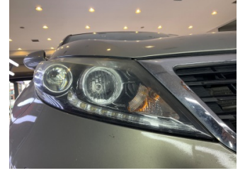
Farlar, Far camı, sağ > Deforme Olmuş