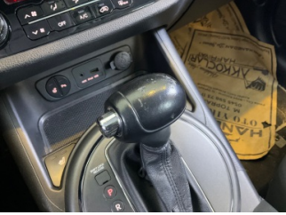
Şanzıman, Vites topuzu > Deforme Olmuş