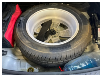
Arka bölüm, Bagaj havuzu > Islak-Nemli