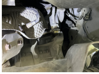
Motor, Triger zinciri kapağı > Yağ Kaçağı