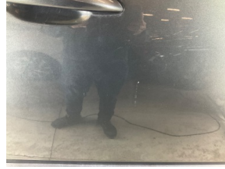
Kapı, sağ ön, Kapı, sağ > Çizik