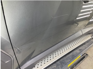
Kapı, sol ön, Kapı, sol > Çizik