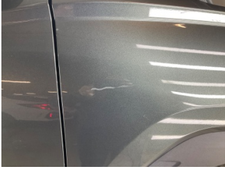
Çamurluk, sağ, Çamurluk, sağ > Çizik