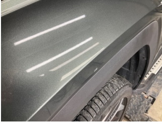
Çamurluk, sol, Çamurluk, sol > Taş izi