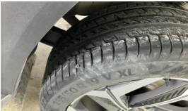
Lastik, sol arka > Hasarlı