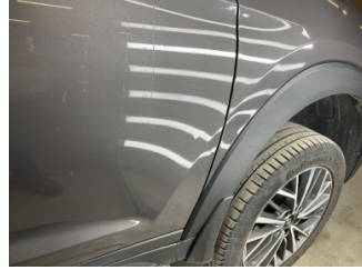
Kapı, sağ ön, Kapı, sağ ön > Ezik