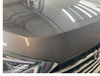
Motor kaputu, Motor kaputu > Taş İzi