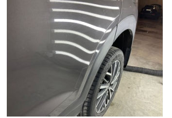
Kapı, sol arka, Kapı, sol arka > Ezik