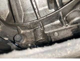
Şanziman, Şanziman > Yağ Kaçağı