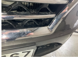
İlave parçalar, ön, Ön panjur > Deforme Olmuş