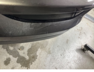
Tampon, ön, Ön tampon > Kırılmış