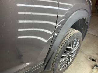
Çamurluk, sağ, Davlumbaz > Ezik