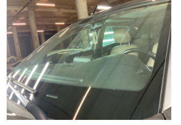
Camlar, Ön cam > Taş İzi