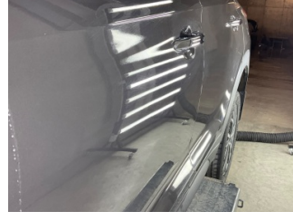
Kapı, sol ön, Kapı, sol ön > Noktasal Ezik