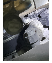
Motorsöğütması, Kayış > Çatlak