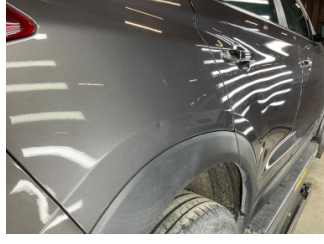
Çamurluk, sağ arka, Çamurluk, sağ arka > Noktasal Ezik