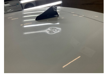
Tavan, Tavan > Rötüş