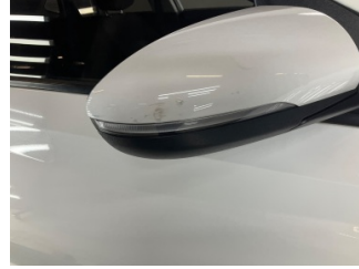
Dikiz aynası, sağ, Dış dikiz aynası kapağı > Çizik