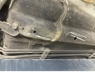
Kaporta, Araç gövdesi altı, arka > Çizik