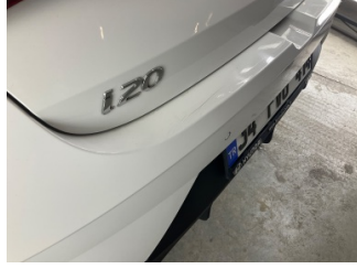
Tampon, arka, Arka tampon > Çatlak