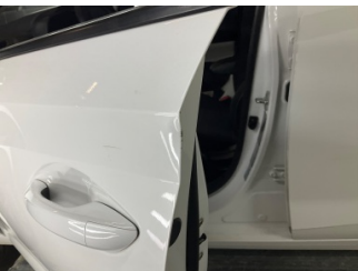
Kapı, sol ön, Kapı, sol ön > Vuruk