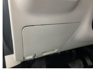
Pano/Göstergeler, Kapak > Delinmiş