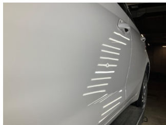
Kapı, sol ön, Kapı, sol ön > Vuruk