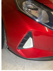
Tampon, ön, Ön tampon > > Çizik