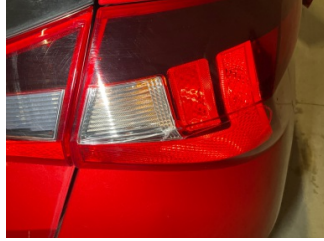
Arka lambalar, Arka lamba camı, sağ > Hasarlı