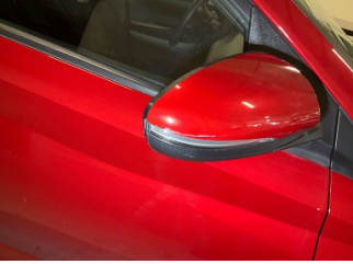
Dikiz aynası, sağ, Dış dikiz aynası kapağı > Küçük Çizik