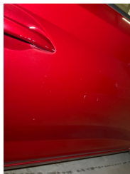
Kapı, sağ ön, Kapı, sağ ön > > Vuruk