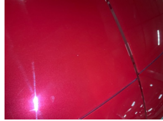
Motor kaputu, Motor kaputu > Taş izi