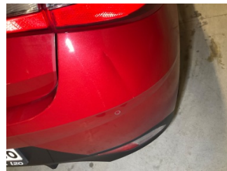
Tampon, arka, Arka tampon > > Ezik