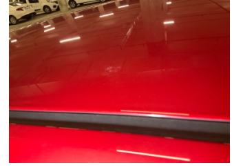
Tavan, Tavan > Yakıcı Madde ile Zarar Görmüş