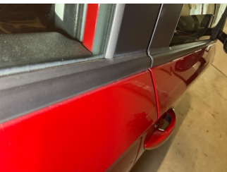
Kapı, sağ ön, Kapı, sağ ön > > Vuruk