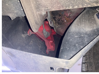
Arka bölüm, Arka sac/panel > Hasarlı