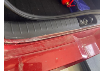
Arka bölüm, Arka sac/panel > Standart Dışı Onarım