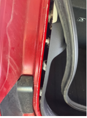
Arka bölüm, Arka sac/panel > Standart Dışı Onarım