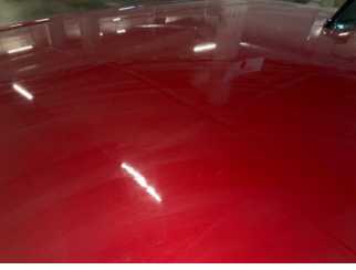
Tavan, Tavan > Standart Dışı Onarım