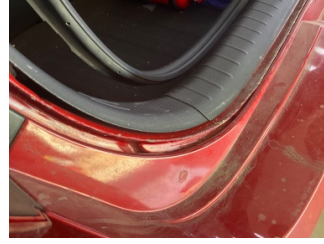
Arka bölüm, Arka sac/panel > Standart Dışı Onarım