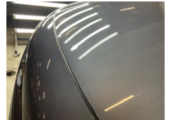
Motor kaputu, Motor kaputu > Dolu Hasarı