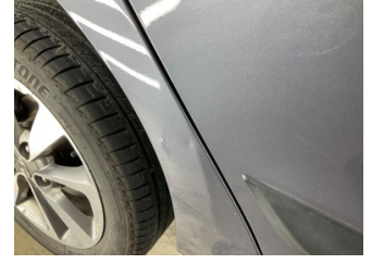
Çamurluk, sağ arka, Çamurluk, sağ arka > Noktasal Ezik