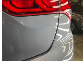
Bagaj kapağı/kapısı, Bagaj kapısı > Çizik