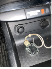
Pano/Gösterge, Pano, orta > Deforme Olmuş

Sayfa: 9/10 Araç Çıkış Tarihi: 22.05.2026 11:13