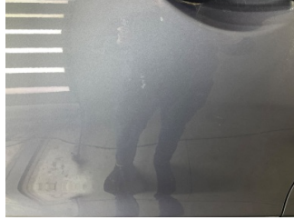
Kapı, sol ön, Kapı, sol > Rötüş