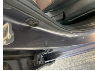
Kaporta, B-direk, sağ > Noktasal Ezik