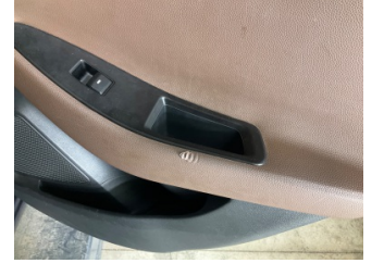
Döşemeler/Kapaklar, Kapı döşemesi, sağ arka > Hasarlı