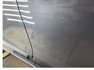
Kapı, sağ arka, Kapı, sağ arka > Noktasal Ezik