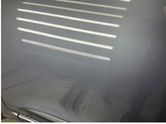
Kapı, sol ön, Kapı, sol > Rötüş