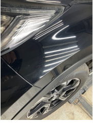
Kaporta, Kaporta > Taş Izi

Sayfa: 10/11 Araç Çıkış Tarihi: 29.06.2026 15:52