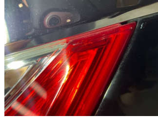
Arka lambalar, Arka lamba camı, sol > Çatlak