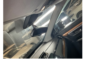
Pano/Göstergeler, İç dikiz aynası > Hasarlı