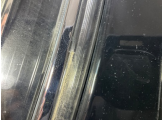
Farlar, Far camı, sol > Çatlak