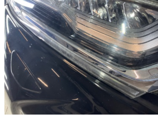
Farlar, Far, sağ > Kirlenmiş