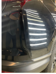
Bagaj kapağı/kapısı, Bagaj kapısı > Noktasal Ezik