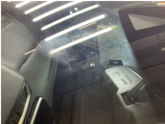
Camlar, Camlar > Çatlak