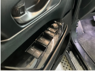
Kapı, sol ön, Cam/Ayna/Koltuk kumanda tuşları > Deforme Olmuş