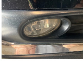
Sis lambaları, Sis farı camı, sağ > Hasarlı