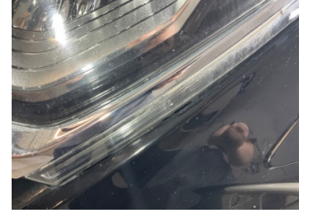
Farlar, Far, sol > Kirlenmiş