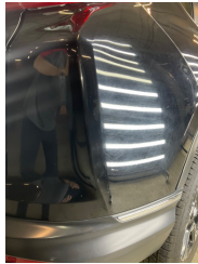
Tampon, arka, Arka tampon > Ezic