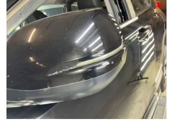
Dikiz aynası, sol, Dış dikiz aynası kapağı > Küçük Çizik