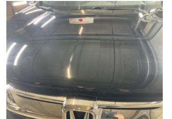
Kaporta, Kaporta > Taş izi