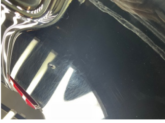
Bagaj kapağı/kapısı, Bagaj kapısı > Standart Dışı Onarım