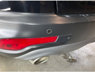
Tampon, arka, Arka tampon > Ezic