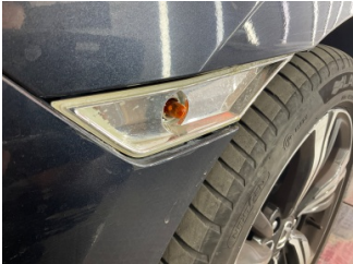
İlave lambalar, İlave far camı, sol > Hasarlı