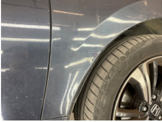
Çamurluk, sağ, Çamurluk, sağ > Standart Dışı Onarım