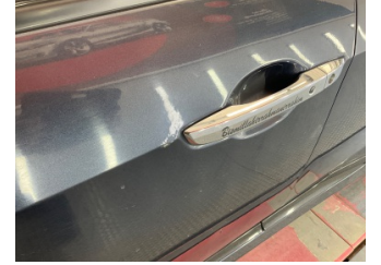
Kapı, sol ön, Kapı, sol ön > Standart Dışı Onarım