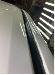
Kaporta, Sol Üst Frangart > Boyası Atmış