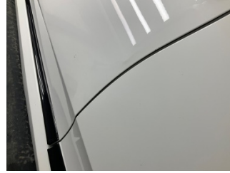
Kapı, sol ön, Kapı, sol ön > Vuruk