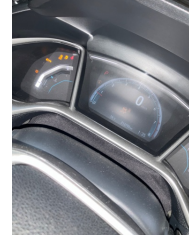
Pano/Göstergeler, Pano/Göstergeler > Uyarı Lambası Yanıyor