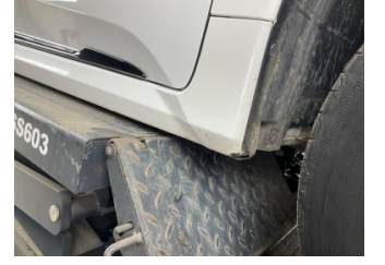
Marşbiyel, sağ, Marşbiyel plastiği, sağ > Rötüş