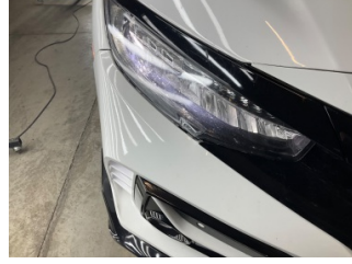
Farlar, Far camı, sağ > Taş Izi