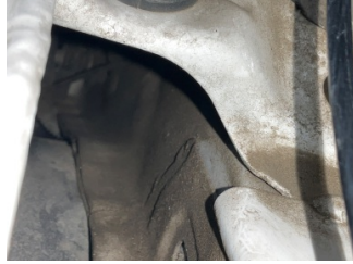
Kaporta, Kaporta > Ezik