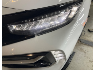
Tampon, ön, Ön tampon > Sabitlemesi Hatalı