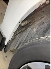
Çamurluk, sol, Davlumbaz > Standart Dışı Onarım