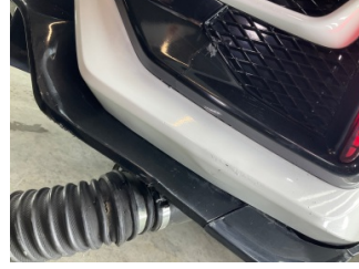
Tampon, arka, Spoiler > Kırılmış