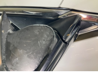
Dikiz aynası, sağ, Dış dikiz aynası kapağı > Hasarlı