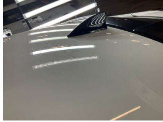
Tavan, Tavan > Deforme Olmuş