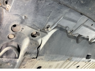
Tampon, ön, Tampon koruyucu orta > Hasarlı

Sayfa: 9/11 Araç Çıkış Tarihi: 20.05.2026 12:12