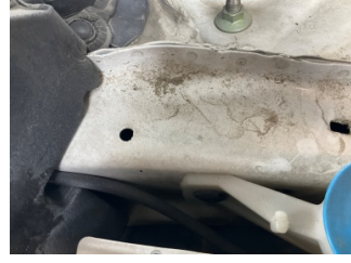
Kaporta, Sağ Kılıç Sacı > Standart Dışı Onarım