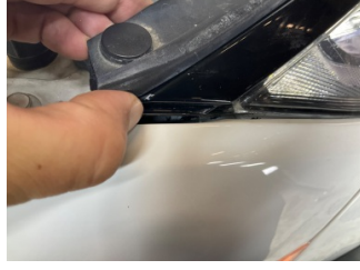
Farlar, Far fitili, sağ > Sabitlemesi Hatalı