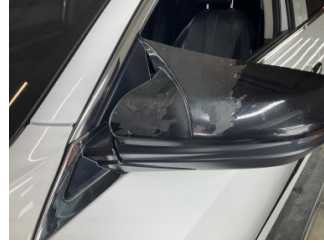
Dikiz aynası, sol, Dış dikiz aynası kapağı > Boyası Atmış