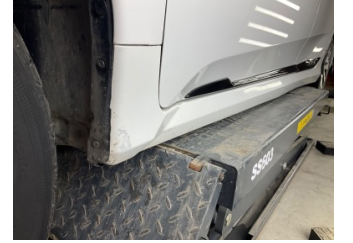
Marşbiyel, sol, Marşbiyel plastiği, sol > Boyası Atmış