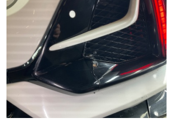
Sis lambaları, Sis Izgarası Sağ > Değişmiş