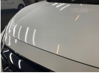
Motor kaputu, Motor kaputu > Deforme Olmuş

Sayfa: 10/11 Araç Çıkış Tarihi: 20.05.2026 12:12