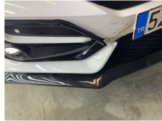
Tampon, ön, Ön tampon > Sabitlemesi Hatalı