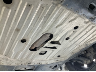
Motor, Alt muhafaza > Ezik