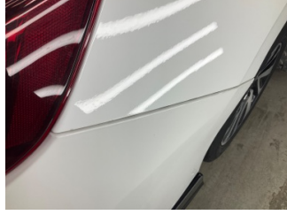
Tampon, arka, Arka tampon > Sabitlemesi Hatalı