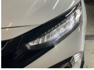
Farlar, Far camı, sol > Taş Izi