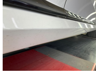
Marşbiyel, sağ, Marşbiyel, sağ > Rötüş