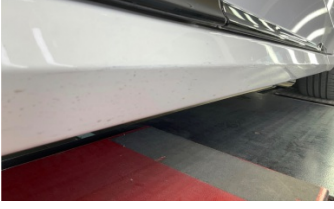
Marşbiyel, sağ, Marşbiyel plastiği, sağ > Rötüş