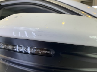
Dikiz aynası, sağ, Dış dikiz aynası kapağı > Rötüş