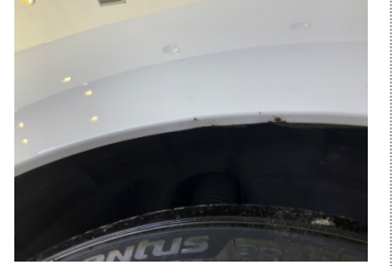
Çamurluk, sağ arka, Çamurluk, sağ arka > Boyası Atmış