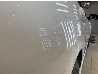
Çamurluk, sağ arka, Çamurluk, sağ arka > Standart Dışı Onarım