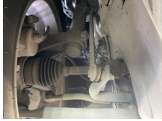
Ön aks, Denge çubuğu, ön > Deforme Olmuş