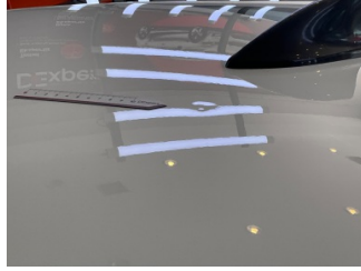
Tavan, Tavan > Standart Dışı Onarım