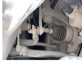
Ön aks, Denge çubuğu, ön > Deforme Olmuş