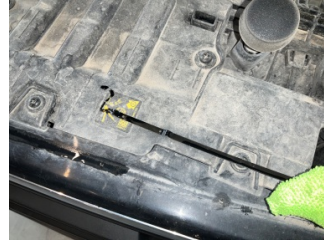
Motor, Yağ seviyesi > Eksik