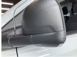
Dikiz aynası, sol, Dış dikiz aynası kapağı > Çizik