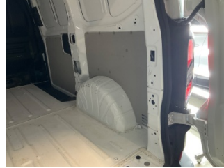
Döşemeler/Kapaklar, Bagaj bölümü döşemesi > Çizik