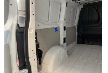
Döşemeler/Kapaklar, Bagaj bölümü döşemesi > Çizik