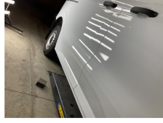
Kapı, sağ arka, Kapı, sağ arka > Vuruk