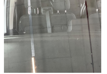
Camlar, Ön cam > Çatlak