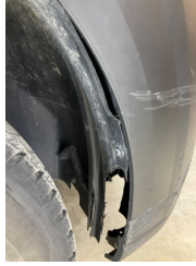
Çamurluk, sağ, Davlumbaz > Hasarlı