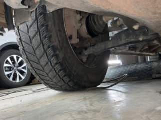
Ön aks, Aks mili, toz körüğü, sağ > Yağ Kaçağı