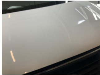
Motor kaputu, Motor kaputu > Taş lzi