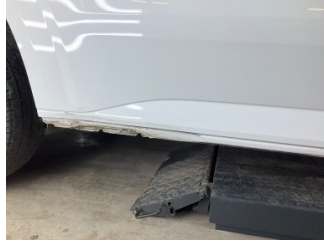
Marşbiyel, sağ, Marşbiyel, sağ > Ezik