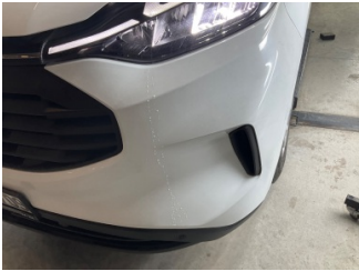
Tampon, ön, Ön tampon > Deforme Olmuş