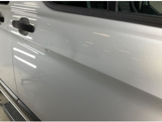
Kapı, sağ ön, Kapı, sağ ön > Taş Izı