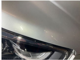
Motor kaputu, Motor kaputu > Taş Izı