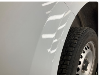
Tampon, ön, Ön tampon > Küçük Çizik