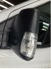
Dikiz aynası, sol, Sinyal lambası > Çizik