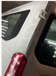
Kaporta, Kaporta > Hasarlı