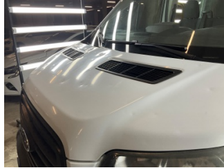
Kaporta, Kaporta > Dolu Hasarı