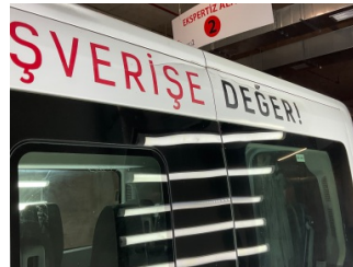
Kaporta, Kaporta > Hasarlı