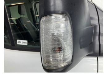
Dikiz aynası, sağ, Sinyal lambası > Islak-Nemli