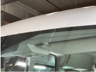
Tavan, Tavan, ön cam üstü > Pas