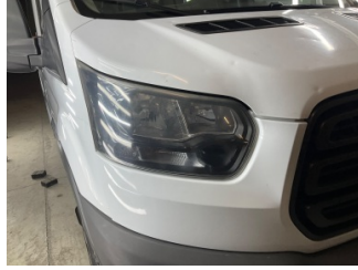
Farlar, Far camı, sağ > Deforme Olmuş