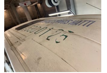
Tavan, Tavan > Çizik