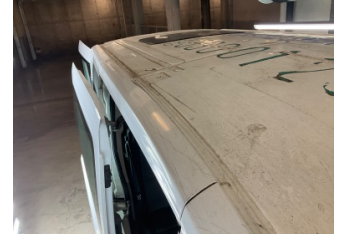
Kaporta, Sağ Üst Frangart > Ezik