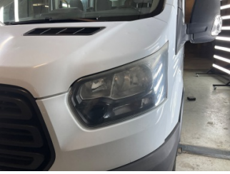
Farlar, Far camı, sol > Deforme Olmuş