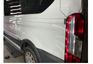
Çamurluk, sol arka, Çamurluk, sol arka > Hasarlı