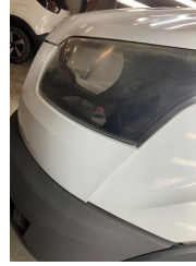
Tampon, ön, Ön tampon > Sabitlemesi Hatalı