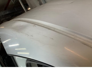
Tavan, Ön cam direği, sağ > Ezik