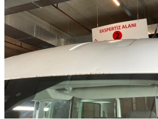
Kaporta, Kaporta > Dolu Hasarı