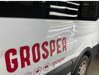
Çamurluk, sol arka, Çamurluk, sol arka > Hasarlı