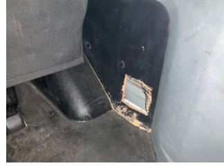
Döşemeler/Kapaklar, Bagaj bölümü döşemesi > Hasarlı