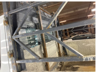
Kaporta, Kaporta > Ezik