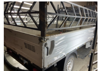
Kaporta, Kaporta > Ezik