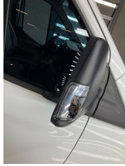
Dikiz aynası, sağ, Sinyal lambası > Hasarlı