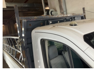
Kaporta, Sağ Üst Frangart > Hasarlı