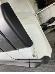
Kaporta, B-direk, sol > Hasarlı