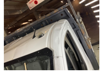
Kaporta, Sol Üst Frangart > Hasarlı