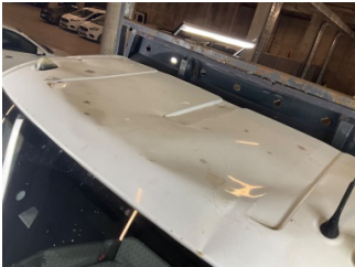
Tavan, Tavan > Hasarlı