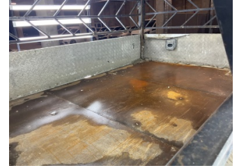
Kaporta, Kaporta > Standart Dışı Onarım