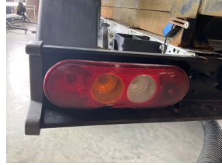
Arka lambalar, Arka lamba camı, sol > Hasarlı