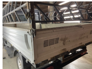
Kaporta, Kaporta > Ezik