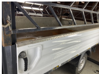
Kaporta, Kaporta > Ezik