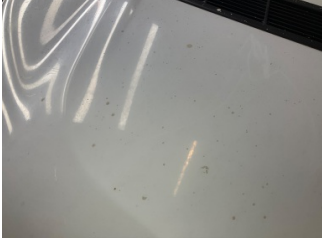
Motor kaputu, Motor kaputu > Kirlenmiş