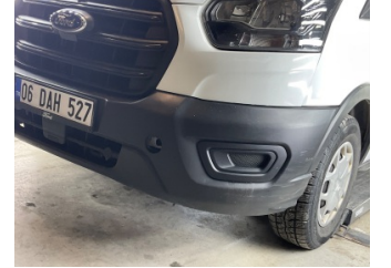
Tampon, arka, Çeki demir kapağı > Sökülmüş-Yok