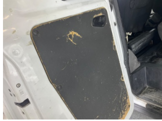
Döşemeler/Kapaklar, Döşemeler/Kapaklar > Hasarlı