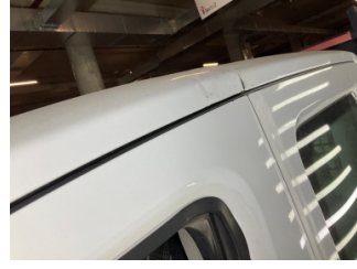
Kaporta, Sol Üst Frangart > Ezik