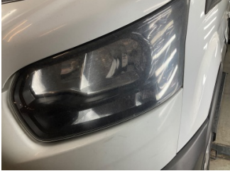
Farlar, Far camı, sol > Çizik