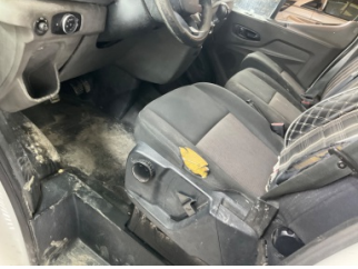
Döşemeler/Kapaklar, Döşemeler/Kapaklar > Hasarlı