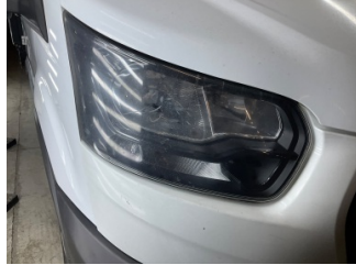
Farlar, Far camı, sağ > Çizik