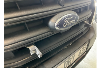
İlave parçalar, ön, Ön panjur > Standart Dışı Onarım