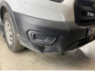
Tampon, ön, Ön tampon > Ezik