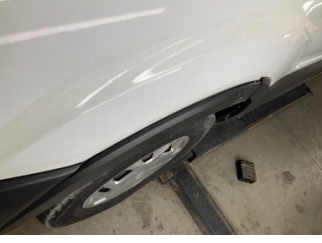
Çamurluk, sol, Nikelaj, ızgara > Sabitlemesi Hatalı

Sayfa: 11/12 Araç Çıkış Tarihi: 30.04.2026 14:40